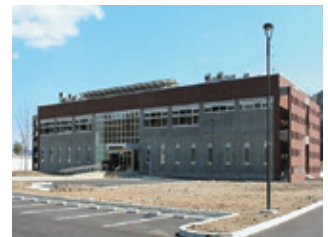
釜石サテライト (3月18日)