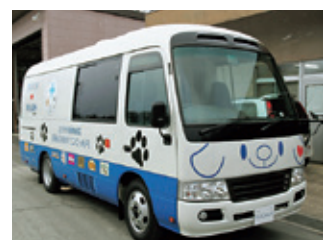
寄贈されたワンにゃん号 (3月22日)