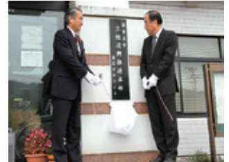
釜石サテライト設置 (10月1日)