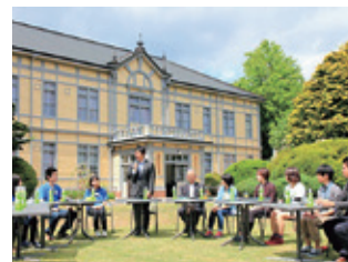
小泉復興大臣政務官との ミーティング (5月31日)