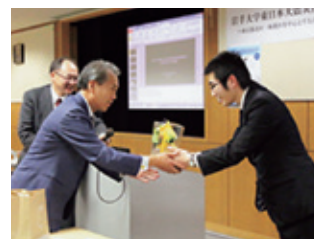
支援の会から被災学生の代表者 に記念品を贈呈 (12月11日)