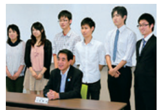
下村文部科学大臣が 釜石サテライトを訪問 (7月10日)