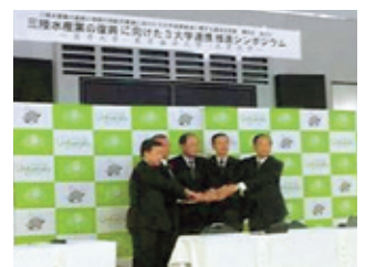
3大学連携推進基本合意書 締結（10月30日）