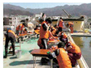
学生ボランティア活動 (4月6日～)