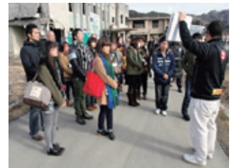
旧大槌町役場の前で説明を受ける学生（1月18日）

1月17日・18日 被災地の現状と復興の取り組みを学ぶ現地研修を実施 岩手の研究を履修している学生と実際に被災地でボランティア活動を行っている学生を対象に、1泊2日の現地研修を実施し、16名が参加。