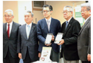
いわて南部地粉そば記者会見 (3月2日)

岩手大学と釜石市の企業との共同研究で誕生した「いわて南部地粉そば」が平成27年度優良ふるさと食品中央コンクール・新技術開発部門にて農林水産大臣賞を受賞したことを受け記者会見を開催。「低酸素気流を利用した粉体用連続式殺菌装置」を開発し、そばの生麺の風味を保ったまま賞味期限を延ばすことに成功。