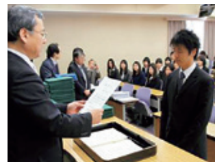
課程ごとの学位授与式 (3月23日)