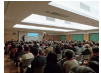
「つながって岩手～東京で広げる被災地コミュニティ～」を開催（12月7日）

11月 9日 第3回全国水産系研究者フォーラムを開催 「震災後の三陸地域における水産業の現状と復興」をテーマに、全国水産系研究者のより一層の横断的ネットワークの構築と三陸復興を目指して開催し、100名以上が参加。