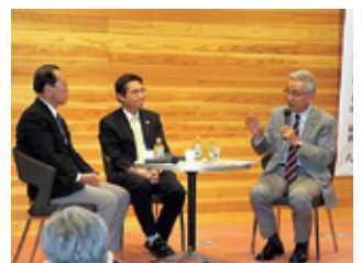
三陸復興・地域創生推進機構発 足記念シンポジウムでのパネル ディスカッション (11月25日)

心のケア班において福島・宮城・岩手で行われている子どもへの支援活動を通して、東日本大震災のこれまでとこれからの心の支援を考えるシンポジウムを開催。