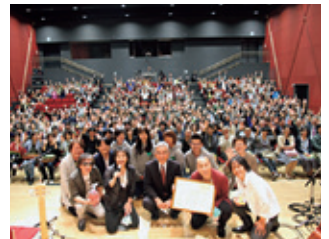
スターダスト☆レビューへ 感謝状贈呈 (6月6日)

音楽グループ「スターダスト☆レビュー」が本学の復興推進活動に10,000,000円を寄附。陸前高田市においてフリーライブを開催し、感謝状を贈呈。