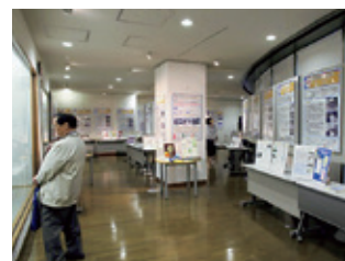
三陸復興推進活動の企画展示 (10月21～11月4日)