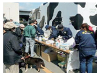
移動診療車での診療 (4月1日～)