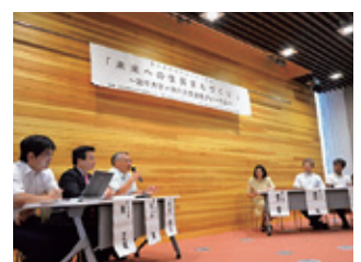
地域防災フォーラム（8月3日）

10月22日 三陸で夏イチゴを作ろう in 田野畑村を開催 三陸沿岸の「夏は北海道よりも涼しく、冬は関東内陸並みに暖かい」という気候の特徴を活かした作物の普及に取り組んでおり、今回は夏から秋にかけて収穫できる夏イチゴの普及を目的に企画。