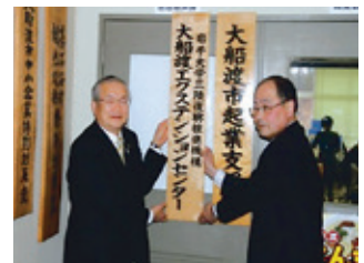
大船渡エクステンションセンター 設置 (4月3日)