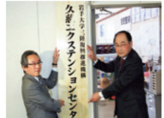
久慈エクステンションセンター 設置 (4月3日)

10月 3日～ 後期全学共通教育科目として「岩手の研究『三陸の復興を考える』」を開設 震災からの復興について学術的観点から検討し、復興への関心を高めるとともに、復興を担う次代の人材を養成することを目的として、東日本大震災の概要、本県における被災状況及び復興に向けての課題・方向性などを総括的に学習し、その上で、復興への岩手大学の取り組みを事例的に学習。