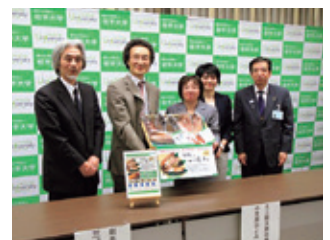
潮騒の一夜干し販売記者会見（6月27日）

6月27日 低温低湿乾燥法による魚介乾製品「潮騒の一夜干し」販売記者会見開催 岩手大学と久慈市の加工販売会社との共同研究で誕生した魚介乾製品「潮騒の一夜干し」販売記者会見を開催。岩手大学の「低温低湿乾燥法」の技術を商品化に応用。 設備導入の段階で、公益財団法人さんりく基金などの助成を受けるとともに、パッケージデザインは県内のプロデュース会社が担当し、産学官が協力したオール岩手の製品となった。