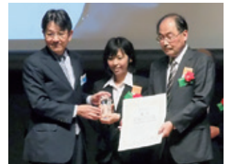
第7回マニフェスト大賞 「震災復興支援・防災対策賞」 最優秀賞を受賞 (11月2日)