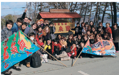
皆で頑張ろう！釜石市宝来館前にて

この研修は、国際的なリーダーを育成するために実施しているもので、5回目となる今回は、復興ツーリズムなどによる持続可能な町づくりの方法やその課題について検討することを通して、参加学生の「地域課題を国際的