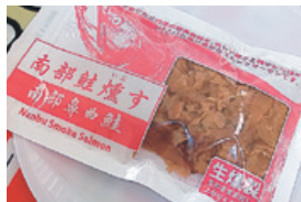
最優秀賞の「鮭冷燻ケズリ」

最優秀賞には南部鮭加工研究会の「鮭冷燻ケズリ」が選ばれ、優秀賞には丸友しまか有限会社の「元祖ぶっかけまんま メカジキのそぼろ煮」と、マルヤマ山根商店の「えぞ鮑肝赤南蛮仕込み」が選ばれました。これら受賞商品を見かけましたら是非お求めいただき、ご賞味ください。