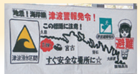
防災タールの図柄

2月19日に、宮古アビリティセンターが運営する障がい者施設商品を販売する店舗「あびさあべ」で行われた完成披露会には、商品デザインに協力した方々や地域防災研究センターの教員も参加し、防災意識を高める事の大切さを伝えました。