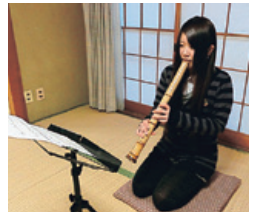
採譜した曲の尺八による演奏

福島第一原発事故以前は自然放射線のみだったため、牧草地内の線量は低く、その分布もランダムでした。このようなところで線量を測って採譜しても、ただの雑音になるだけです。原発事故により降り注いだ放射性セシウムのため線量が高くなり、しかもその分布は不均一なため独特の曲が生まれました。原発事故から3年が経過し、放射性セシウムの半減期により線量もほぼ半分以下になってきました。今回採譜したこの曲も、次第に音量が小さくなり、やがては消えてもとの静けさを取り戻すでしょう。原発事故がもたらした泡沫の音楽は、生まれるべきものではありませんでしたが、原発事故が起き、たまたま調査したことで聞くことができました。もう2度とこのような音楽が生まれないことを願っています。