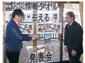
防災タールを受け取る 地域防災研究センター教員

今後、様々なプロジェクトが展開される中で、現場窓口としてサポートさせていただきます。