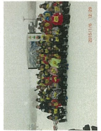
フィールドスタディ（スキー）