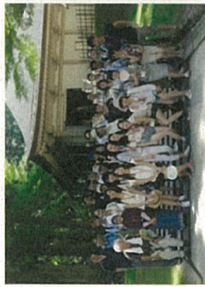
フィールドスタディ（見学旅行）