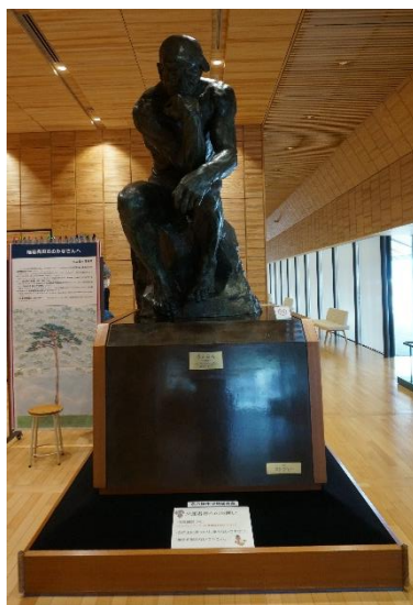
図2 オーギュスト・ロダン《考える人》陸前高田市立博物館 （名古屋市立博物館から貸出中）