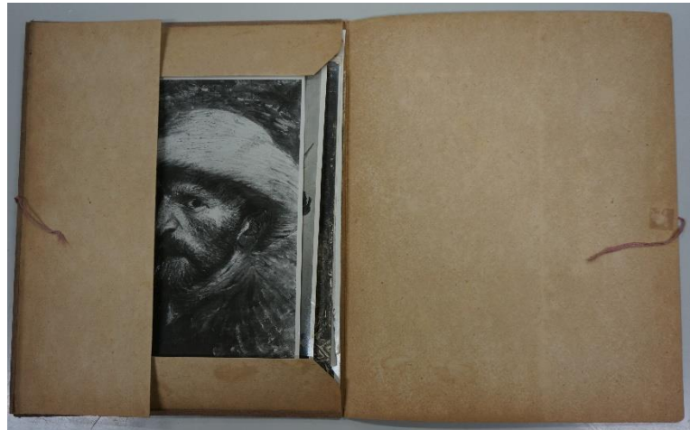
図1 『オーギュスト・ロダンのデッサン』紙挟 表紙・内側 （兜屋画堂開催「ロダンのデッサン複製展覧会」刊行物）1919年