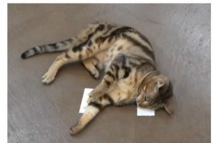
マタタビ° キャットニップ°

注 1. アメリカンショートヘア、エキゾチックショートヘア、マンチカン、スコティッシュフォールド、メインクーン、ミヌエット、ペルシャ、ロシアンブルー、ベンガル