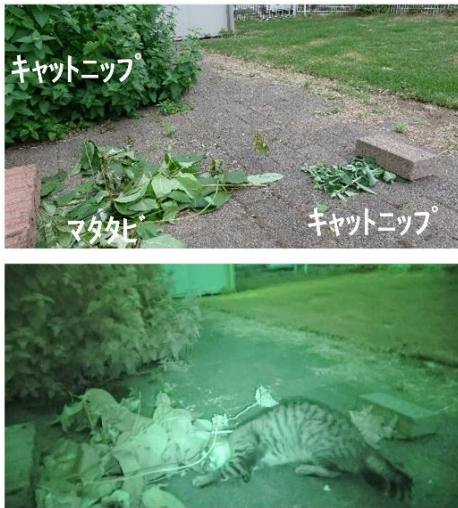
図 1. 屋外の自由行動下におけるネコの反応性の違い

キャットニップが植えられている民家の庭に、採取後数時間以内のマタタビとキャットニップを置き、暗視カメラで自由に入りするネコの行動を観察した。延べ 10 日間の観察で、6 匹のネコが計 23 回訪れた。そのうち 5 匹で計 21 回の擦り付け・転がり反応が観察されたが、いずれもマタタビに対する反応であり、キャットニップへの同様の反応は見られなかった。