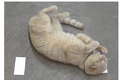
キャットニップ° マタタビ°

アメリカ、イギリス、ロシア、イランなどに由来する 9 品種(注 1)からなる 22 匹の飼育純血種ネコを対象に、通常の飼育環境下でマタタビ抽出液とキャットニップ抽出液を同時に提示して反応性を調べた。ケージを使った実験と異なり、ネコは提示物に近づくか、嗅ぐか、無視するかを自由に選べる条件で試験された。22 匹のうち 15 匹はマタタビ抽出液のみに擦り付け・転がり反応を示し、3 匹はキャットニップ抽出液のみに、1 匹は両方の抽出液に反応した。残り 3 匹はにおいを嗅いだものの、擦り付け・転がり反応を示さなかった。これらの結果は、日本のネコだけでなく、海外由来のネコであってもキャットニップよりマタタビに対する反応が有意に高い傾向が観察された。